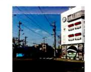
高級感漂洋菓子店、ゴアール帝塚山本店は姫松駅の真ん前。

安倍晴明神社 阿倍野区阿倍野町5-16 (お問い合わせは安倍王子神社まで) 阿倍王子神社は熊野詣の街道に沿って設けられた九十九(くじゅうく)王子の一つとされ、阿倍野の王子社ということで名付けられた。末社に平安時代の陰陽師で有名な安倍晴明を祀っている安倍晴明神社がある。晴明は阿倍野区阿倍野生まれといわれており、「安倍晴明生誕の地」の石碑もある。社務所では安倍晴明公顕彰会による占いも受付。