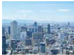
空中庭園からの眺め