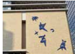
中之島フェスティバルタワー