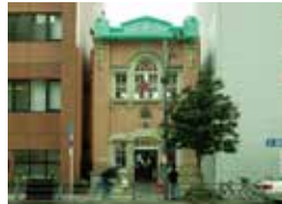
北浜レトロビルディング